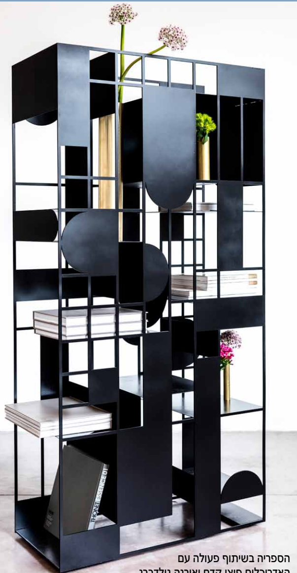
הספרייה בשיתוף פעולה עם האדריכלים פיצו קדם ואירנה גולדברג

גלריית 'ארטיגיאני' נוסדה על ידי לאה ואנדראה ואנוצ'י לפני כ-25 שנה והפכה במרוצתן לשם נרדף לאיכות בלתי מתפשרת וייחודיות בכל הקשור לעיצוב במתכת בעבודת יד.